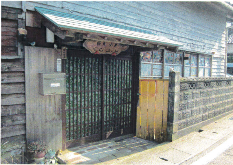
(左) 作業場 (下左) 名人の渾身の作品「不死鳥」 (下右) 六歌仙貝