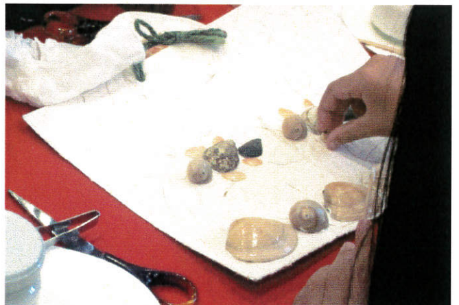
(上) ティッシュで作られたしおり (下) 貝細工を体験してきた子供の様子