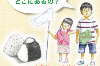
こたえはここをめくってね!

せ かい の う ギょう い さん 世界農業遺産 って だれ に いて い 誰が認定するの？ どこにあるの？