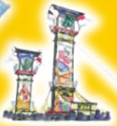
石崎奉祭 (いさきほうとうまつり)